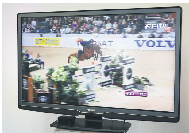
Der Pferdesport hat kaum mehr einen Stellenwert im TV.