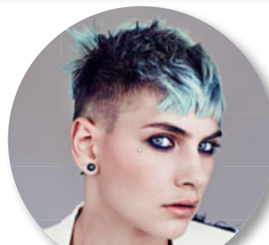
Blondme and Shy & Flo by Schwarzkopf Professional