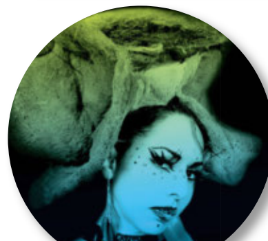
Swiss HairTalent 2017 by coiffureSUISSE