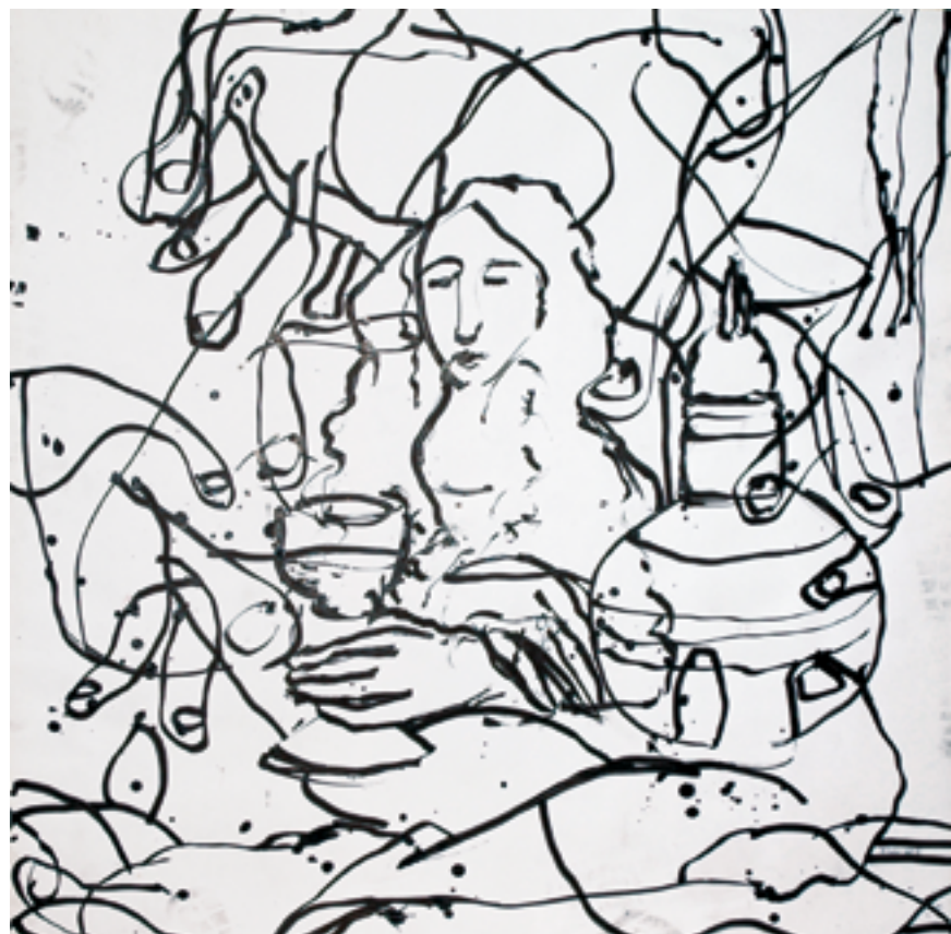
Philippe Saxer Koppelaarster , 1994 Oost-Indische inkt op papier 100 x 100 cm Collectie Otto Frick